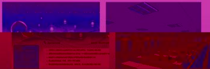
图 5-1-1 工程实践创新项目